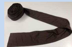
昆布レプリカ(全長12m)