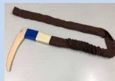
鉤竿レプリカ(全長6.5m)